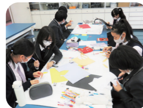
大阪で起こった空襲