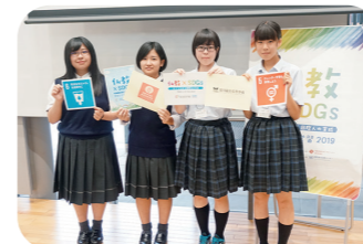
2泊3日の夏期交流学习

*西本願寺の関係学校によって構成されている日本最大規模の組織。(24学園72校)。