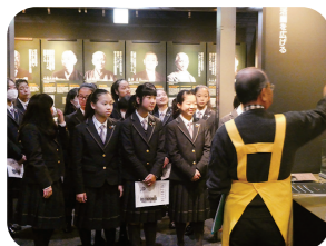
大阪起業家ミュージアム見学