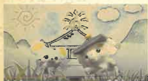
ゾウさん劇場「お寺でパオ〜ン！」