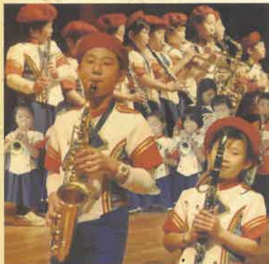
本町キッズ・谷町キッズ ポップフィルハーモニー楽団