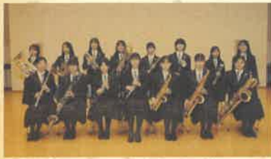
相愛中学・高等学校 吹奏楽部 受賞歴：吹奏楽コンクール 大阪大会金賞 関西大会銀賞